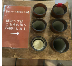
コップの形にすることで 見た目よし、ごみ袋削減