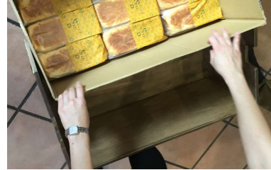
安全性、機能性を考えたパンの ストックを段ボールごと入るス トックケース